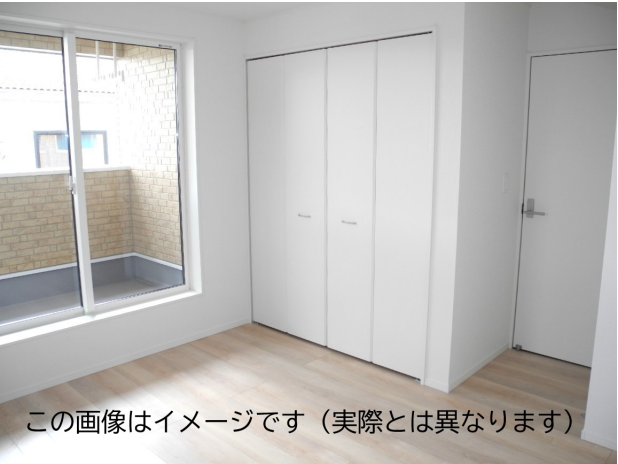
この画像はイメージです（実際とは異なります）